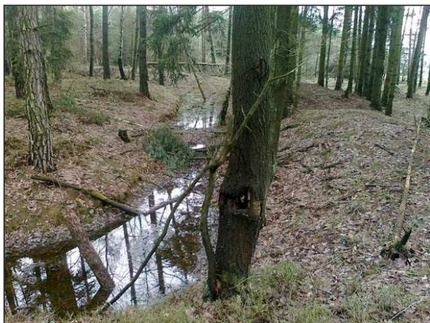
Pohled z jižního nároží valu na zavodněnou východní část příkopu.

Na řadu tedy přichází tradice „švédských šancí“ (viz výše). Jsou však známy případy, že „švédskými šancemi“ byly nazývány i zcela jiné objekty, jeho třeba pravěká či slovanská hradiště. 7) Přesto je třeba se u šancí (opevnění z třicetileté války) zastavit. Šance, trvalé opevnění, se většinou stavěly k ochraně a kontrole komunikací na strategických místech, jako byly např. průsmyky. Z písemných pramenů jde najevo, že při výstavbě těchto opevnění bylo zapotřebí množství dřeva – kmenů, a také zemních prací. 8) Fortifikace u sv. Barbory však jistě nebyla vystavěna k ochraně zcela bezvýznamné cesty. Ze strategického hlediska má její umístění pouze jednu výhodu – byl odtud velmi daleký rozhled a vizuálně bylo možné kontrolovat již zmíněnou hlavní komunikaci, v nejbližším bodě však vzdálenou 4,5 km vzdušnou čarou. Fyzická kontrola této důležité silnice z opevnění u sv. Barbory nebyla možná. Že by opevnění bylo zbudováno jako strážné je velmi nepravděpodobné – strážné zjištěná v polohách dalekého rozhledu, alespoň pokud je známo, nebyla opevňována. 9)