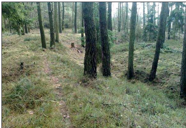
Pohled ze západního na severní nároží.

Svým čtvercovým tvarem opevnění evokuje redutu. Ovšem definice (dělostřelecké) reduty zní: Reduty, útočné fortifikace, důvodem jejichž vybudování bylo stanoviště pro dělostřelectvo obléhající určitý objekt. Také mohly být součástí liniového opevnění vojenského tábora. Na vnitřní plošině byla umístěna děla. Do rozměrů zkoumaných redut 10) by se opevnění u sv. Barbory vešlo, ovšem není zde objekt hodný obléhání, ani opevněný tábor. Opevnění nemohlo být použito jako dělostřelecké, neboť má na rozdíl od zkoumaných redut, kde plošinu obklopuje násep a až potom pří-