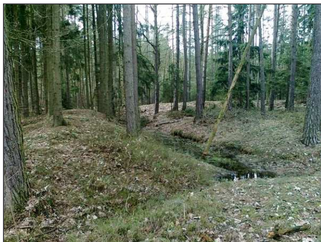
Východní nároží opevnění s odtokem vody

kop, 11) vnitřní plošinu obklopenou napřed příkopem a až potom valem – děla by při přímé střelbě střílela do tělesa valu. Snad by mohla být umístěna v rozšířených místech na koruně valu, avšak v takovém případě by nebyla nijak chráněna.