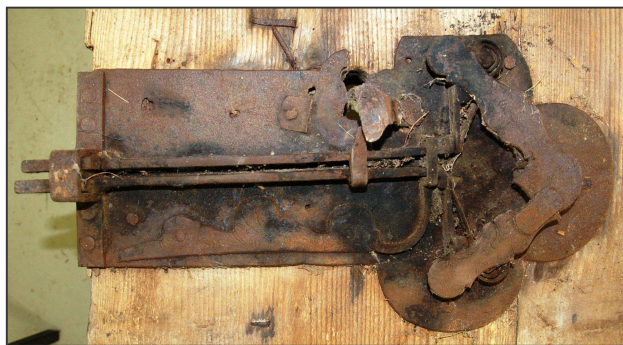
Zámek dveří z Pušperku.

V levé části lícové plochy, zhruba v polovině výšky dveří je zámkové kování, které tvarově a tematicky spadá do poloviny 18. století. Výška tohoto kování je 30 cm a šířka činí 9 cm. Spodní část kování je vypracována tak, že vytváří rostlinný listový motiv. Ve středové části, která se kruhovitě rozšiřuje, je proražen otvor pro zasunutí klíče. Horní část kování je opět upravena do rostlinného motivu, který vzdáleně připomíná trs trávy. Po celé ploše kování je provedeno dozdobení rytými liniemi. Kování je k ploše dveří připevněno čtyřmi drobnými hřebíčky. Toto kování je i přes povrchovou korozní vrstvu v poměrně dobrém stavu. Vedle kování je směrem k levému kraji zapuštěno kované očko s petlicí, které bylo k těmto dveřím doplněno pravděpodobně v mladším období.