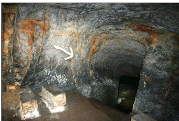
Vstup do třetího patra.