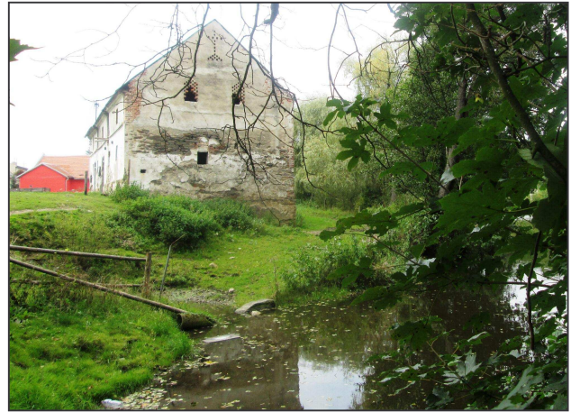
Pohled na tvrziště v Úněšově z hráze rybníka.

Stabilní katastr Úněšova z roku 1839 ukazuje intravilán vsi tvořený usedlostmi situovanými pravidelně kolem prostorné návsi, v jejíž jižní části stojí kostel sv. Prokopa. Pravidelnost zástavby je v severovýchodní části narušena okrouhlým tvarem několika parcel vnikajícím do rybníka. Ústřední prostor tvoří nádvoří na severovýchodě ohraničené obdélnou budovou s drobným rizalitem vystupujícím směrem k rybníku, proti ní stojí taktéž zděné nevelké stavení