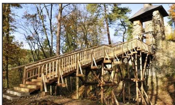
Nový most za Zlenicích.

Zřícenina hradu Zlenice-Hláska (okr. Praha-východ) je turistům lépe přístupná. Obec nechala postavit unikátní dřevěný most, po němž se lze dostat do hradu. Nejde o historickou kopii původního mostu přes hradní příkop, ale byly použity tradiční stavební postupy i materiál. Náklady překročily milión korun (R. Plavecký, Právo).