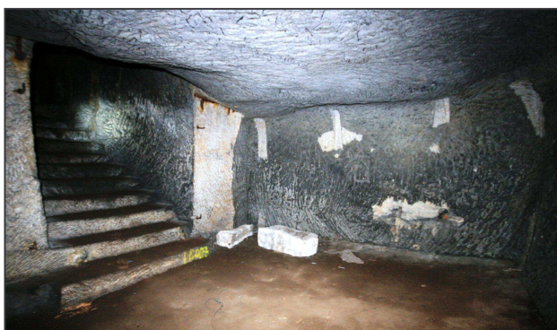
Čtvrté patro děčínského podzemí.