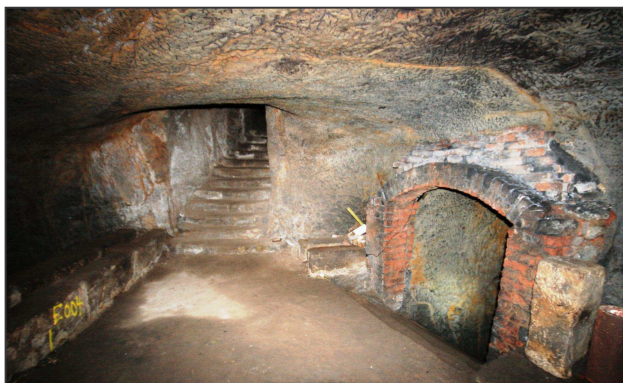
Vlevo schodiště z centrální chodby, vpravo vstup do dalších pěti pater.