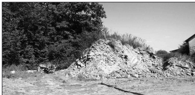
Bačkov – pohled od jihozápadu 7. 9. 2014.

Asociace majitelů hradů a zámků byla založena roku 1995. Sdružuje 44 soukromých vlastníků historických objektů. Adresa: Korunní 73/1257, 130 00 Praha 3, e-mail: info@amhz.cz .