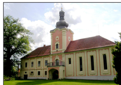
Zámek v Lešanech 2014.

Pro milovníky rekonstruovaných a tím i zachráněných šlechtických sídel je možné doporučit návštěvu zámku v Lešanech (okr. Benešov). Současnému soukromému majiteli se podařilo během dlouhých let zámek se zahradou a hospodářskými budovami opravit výhradně ze svých zdrojů bez jakýchkoli dotací, a to včetně interiérů, pod dohledem NPÚ. Na zámku je možné po domluvě s majitelem a po zaplacení 40 Kč vstupného si