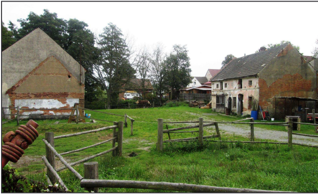
Nádvoří bývalého čp. 11 (stavební parcela č. 35).