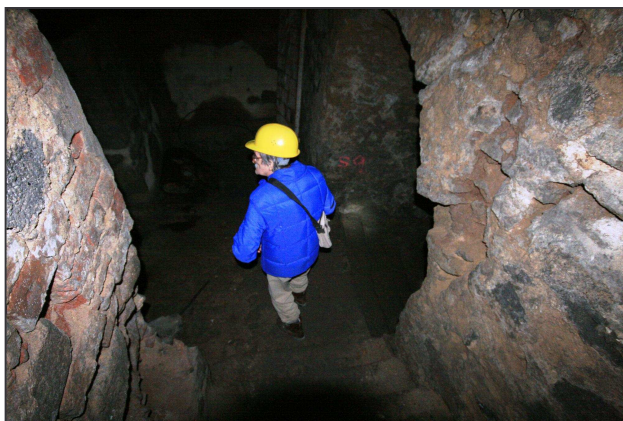
Páté patro a autor příspěvku.