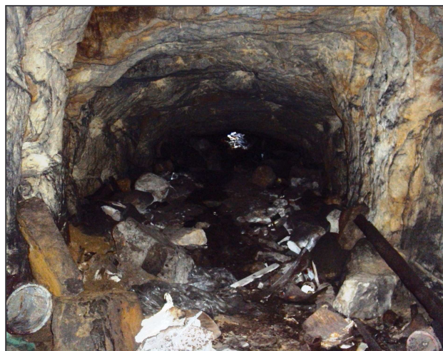
Chodba ze studny v děčínském hradu.

Nejzajímavější je podzemí gotické, nacházející se pod nejstarší částí zámku. Nalézá se zde též původní studna, kterou obtáčí nízka a úzká chodbička s portálkem, který umožňoval odběr vody z nitra hradu. Studna je dnes bez vody. Pramen se mohl buď ztratit, nebo po zavedení barokního vodovodu přestalo být o ni pečováno a stala se odpadní jámou. V parku pod hradem je zanesený a vegetací pokrytý