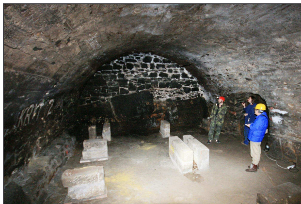
První patro s šínami na sudy a členové společnosti Agartha.