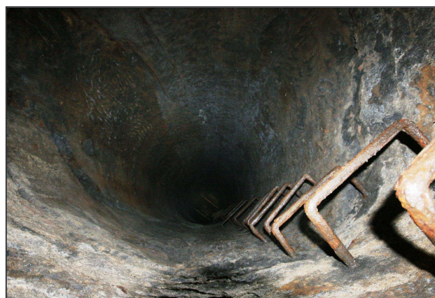
Tubus studny se stupačkami, které tam měla umístit německá armáda.

vstup do chodby, vedoucí do nyní z poloviny zasypaného studničního tubusu, který původně dosahoval až k úrovni nedaleké řeky.