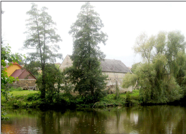
Pohled na tvrziště v Úněšově přes rybník.