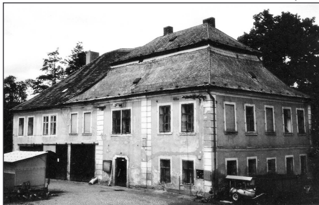
Bačkov – pohled od jihovýchodu 1992.