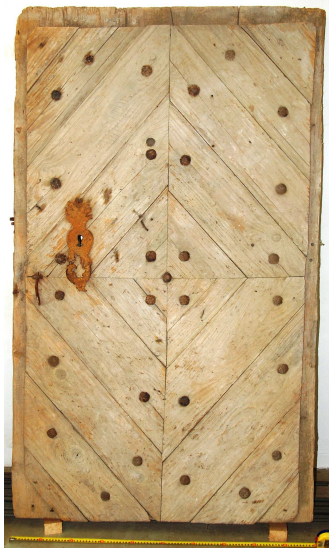
Dveře z Pušperku.

Dveře, které jsou předmětem tohoto příspěvku, byly objeveny v jedné stodole ve vsi Bezpravovice. Dle sdělení majitele usedlosti, který informaci o jejich původu získal od svých předků, pochází tyto dveře z hradu Pušperka. Byly z původního místa přeneseny do Bezpravovic, kde byly použity jako vstupní dveře u stodoly. Tyto jednokřídlé