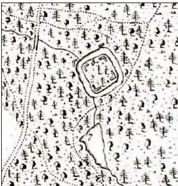
Okolí Lesního hradu na výřezu z Chotkova plánu (cit. v pozn. 2).

Součástí úprav byl i vyhlídkový kopec (tzv. mohyla), který vznikl jako poslední z krajinářských úprav na počátku 19. století. Jednou z romantických staveb byl i Waldburg – Lesní