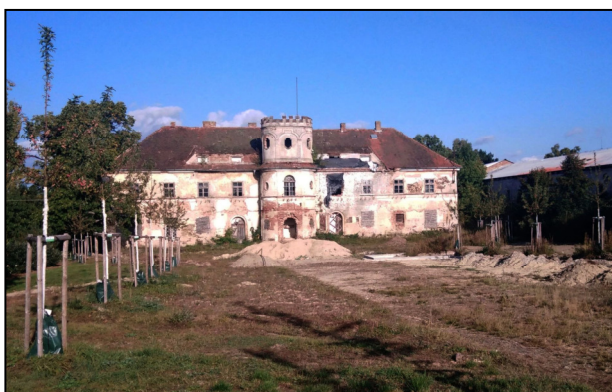
Ve Slavicích se zatím našly peníze jen na park před zámkem.