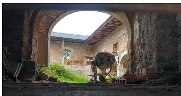
Zámek Kopec (všechna foto P. Mikota).

Autovycházka na Tachovsko. Na konci září, přesněji 30. 9., se konala tradiční podzimní vycházka plzeňské pobočky KASu, tentokrát směřovaná na Tachovsko. Menší skupina vyrazila ráno od hlavního nádraží nejdříve do Skapců, kde si prohlédl exteriéry kostela a fary – pravděpodobně rezidenci kladrubských opatů. Zde se přidalo také další účastnické auto. Další posily dorazili na následující lokalitu, totiž zříceninu zámku Kopec v Prostiboři. Počasí nám příliš nepříšlo