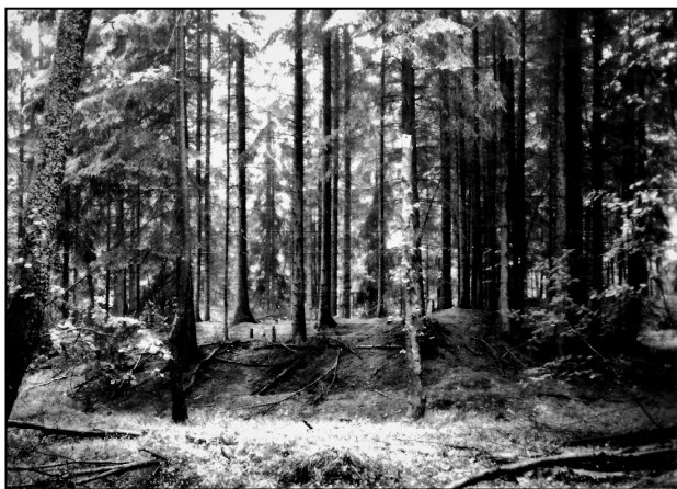
Lesní hrad u Radvančic v roce 1993 ještě před obnovením rybníka.

zámeček na ostrůvku v rybníku. Na nedatovaném plánu Sidoniina lesa od V. F. Chotka jsou vidět i podrobnosti v areálu tvrziště – pravidelná náročná, zalesnění nádvorí i výše položený rybníček. Předhradí patrně v terénu zde ale zakresleno není.