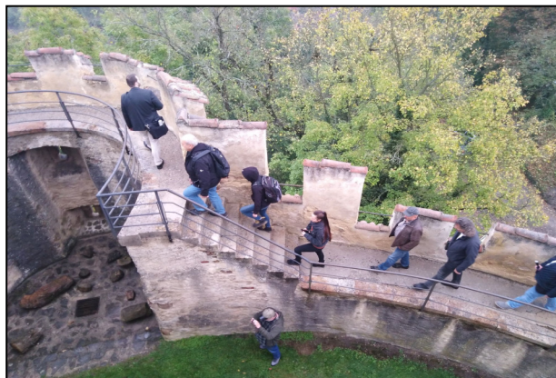
Součástí konference byla i speciální nestandardní prohlídka hradu.